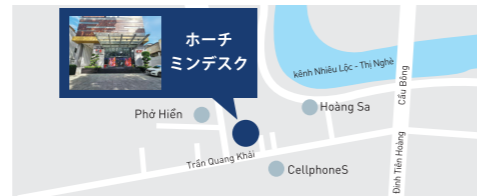
ホーチミンデスク