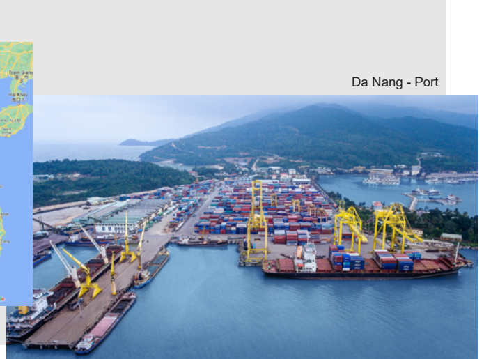
Da Nang - Port