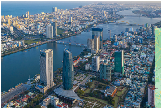
Da Nang - City

今回は、ダナンの特徴やハノイ・ホーチミンとの違い、中小企業の新たな海外展開先としての可能性を中心にお伝えします。