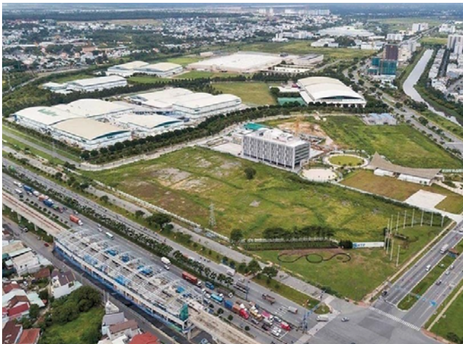
Sai Gon Hi-tech Park

ベトナムは、2045年までにデジタル国家になるという目標のもと、国家戦略「メイク・イン・ベトナム」を掲げています。先に述べた通り、多くの利点があるベトナムでの半導体チップの生産は国家戦略に沿っていると言えます。そのため、ベトナム政府は世界中の半導体に関わる大企業をベトナムに誘致し、ベトナム国内での研究開発拠点の設立や研究開発拠点の拡大を目指し、半導体産業にいくつかの優遇措置を与えています。特定の基準を満たす半導体関連企業は、土地、法人所得税、付加価値税、輸出入関税に関する法律に基づき、最高レベルの優遇措置を受けることができるほか、研修、研究、生産試験開発のための資金援助も受けられます。また、投資資金に関する追加条件を満たした企業は、税と地代がさらに減免されます。現行の優遇措置以外にも、ベトナム政府は国家イノベーションセンター（NIC）を設立し、ホーチミン、ハノイ、ダナンに3つのハイテクパークを設置しているほか、半導体エコシステムの拡大に備えて、半導体産業の開発戦略を策定しています。