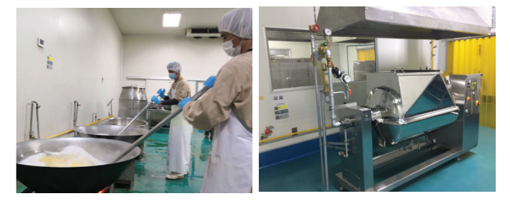
ระบบอัตโนมัติ Before → After